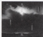
『真南風/マーバイ』(2001) Ishigaki Kinsei + Hideaki Masago + Masami Endo